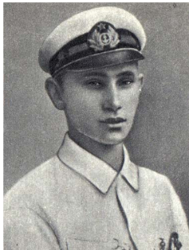
Кожанов Иван Кузьмич (12.05. 1897 – 22.08. 1938)

И ван Кузьмич Кожанов родился в станице Вознесенской Кубанской области в семье кузнеца. По окончании реального училища в Ростове-на-Дону сдал экзамены в Петроградский горный институт. Однако учиться в нём 19-летнему студенту фактически не пришлось. В 1916 году его призвали на военную службу, направив для учебы в столичные Отдельные гардемаринские классы. Летом 1917 года Кожанов был направлен для прохождения корабельной практики во Владивосток, а в феврале 1918 года – на службу в военный отдел Наркомата по морским делам. Жизнь Ивана Кузьмича совпала с