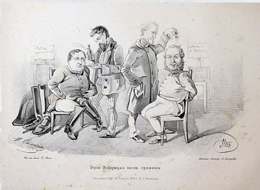
Степанов Н. А. Из альбома «Карикатуры». 1855 г.