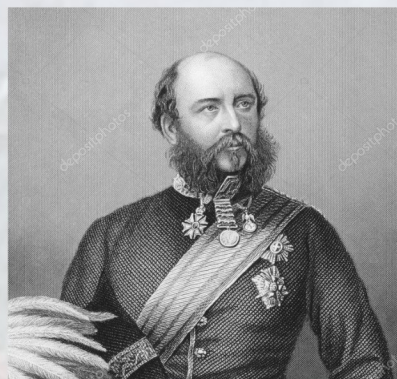
Георг Вильям Фредерик Чарльз, герцог Кембриджский, дивизионный генерал