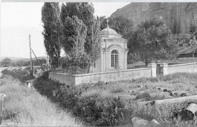
Часовня в память погибших в Инкерманском сражении

В 1885 году в Инкермане построили часовню. Ежегодно в день Инкерманской битвы духовенством из монастыря проводился к ней крестный ход. В 1903 году после доклада представителя «Комитета по восстановлению памятников Севастопольской обороны 1854–1855 гг.» Николай II повелел восстановить этот храм как памятник павшим в Инкерманском сражении.