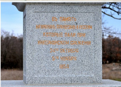
Надпись на памятнике на русском и английском языках