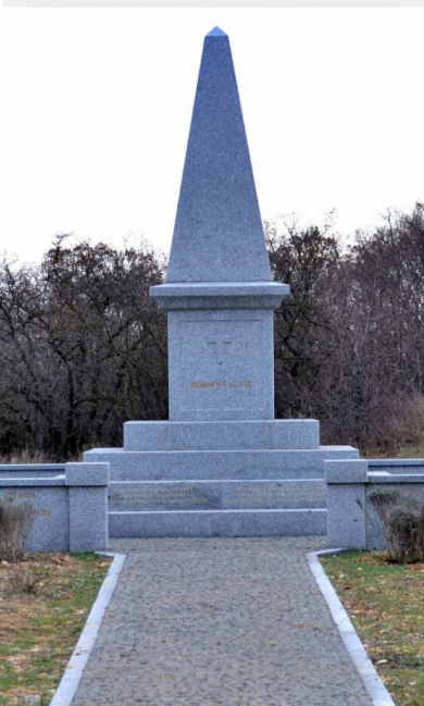
Английский памятник на месте Инкерманского сражения. 1856 г.