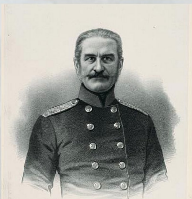
Генерал от инфантерии П. А. Данненберг