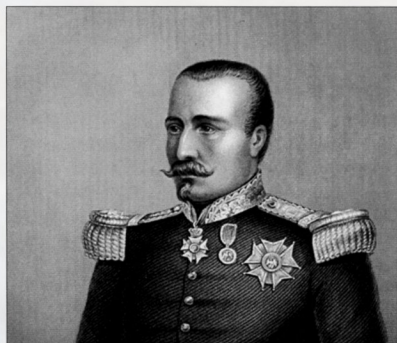
Пьер Франсуа Жозеф Боске, генерал, командир наблюдательного корпуса.

Сражение началось в 7-ом часу утра на Килен-балочном плато, когда отряд генерала