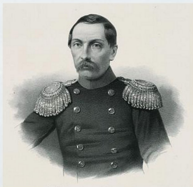
Генерал-лейтенант Ф. И. Соймонов

К поражению русской армии привела слабая подготовка сражения: отсутствие четкой диспозиции, незнание местности (карты местности войска получили только на следующий день после сражения), также исход сражения решило преимущество в вооружении армии противника — гораздо более дальнобойные, чем находящиеся на вооружении русской армии, ружья системы Минье. Вместе с тем, существует и другая точка зрения на причину неудачи русской