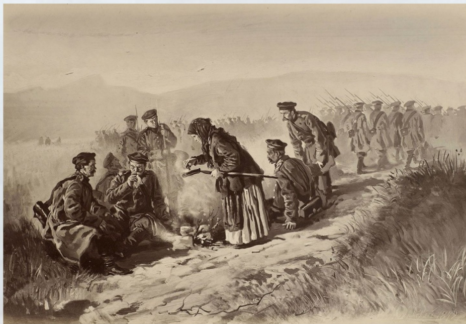
Маковский В. Е. «Сцена после Инкерманского боя» 1872 г.

Англичане на поле брани установили два памятника. Первый — на правом фланге их позиций, на валу бывшей батареи. Представлял он