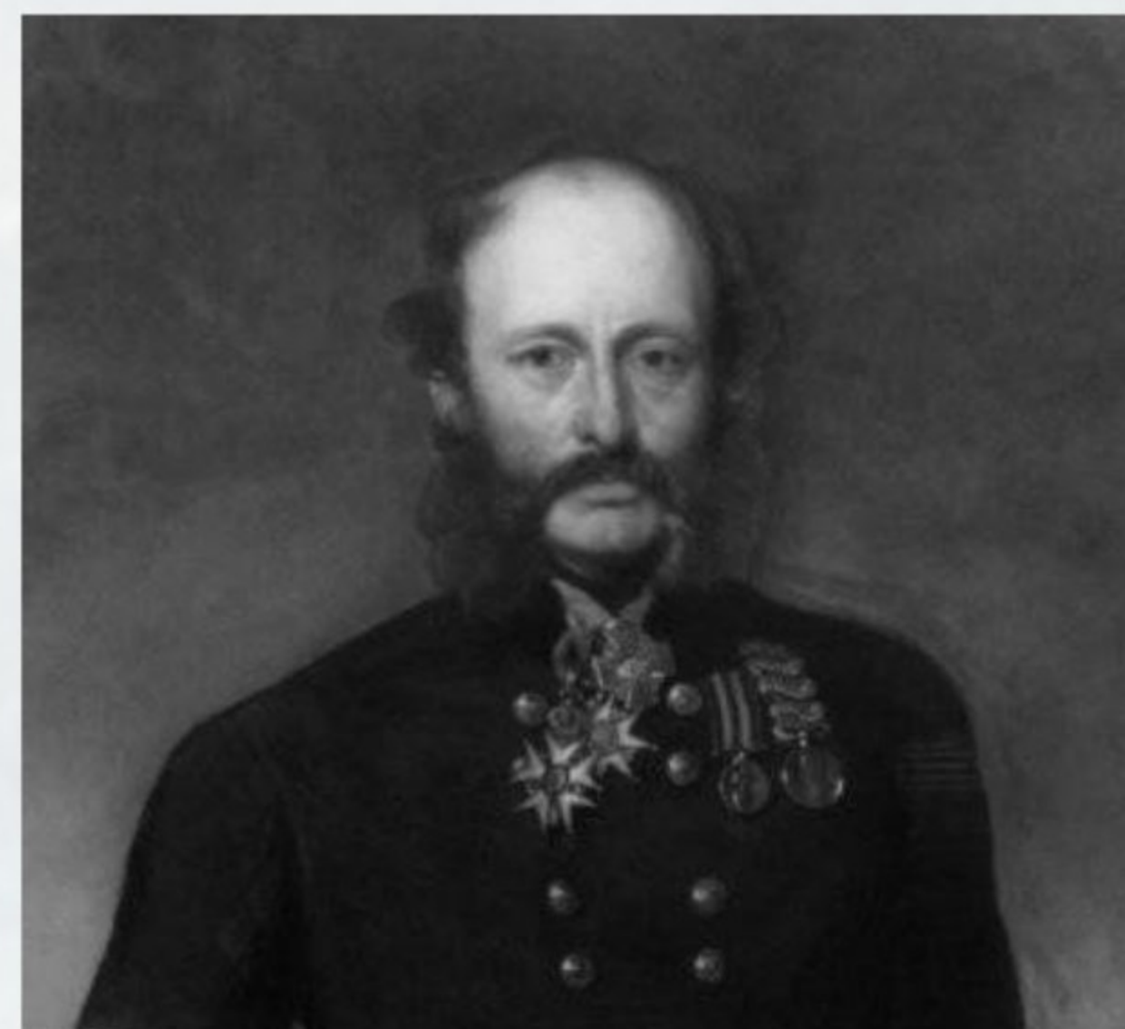
Генерал-майор лорд Джордж Лукан, командующий британской кавалерией.