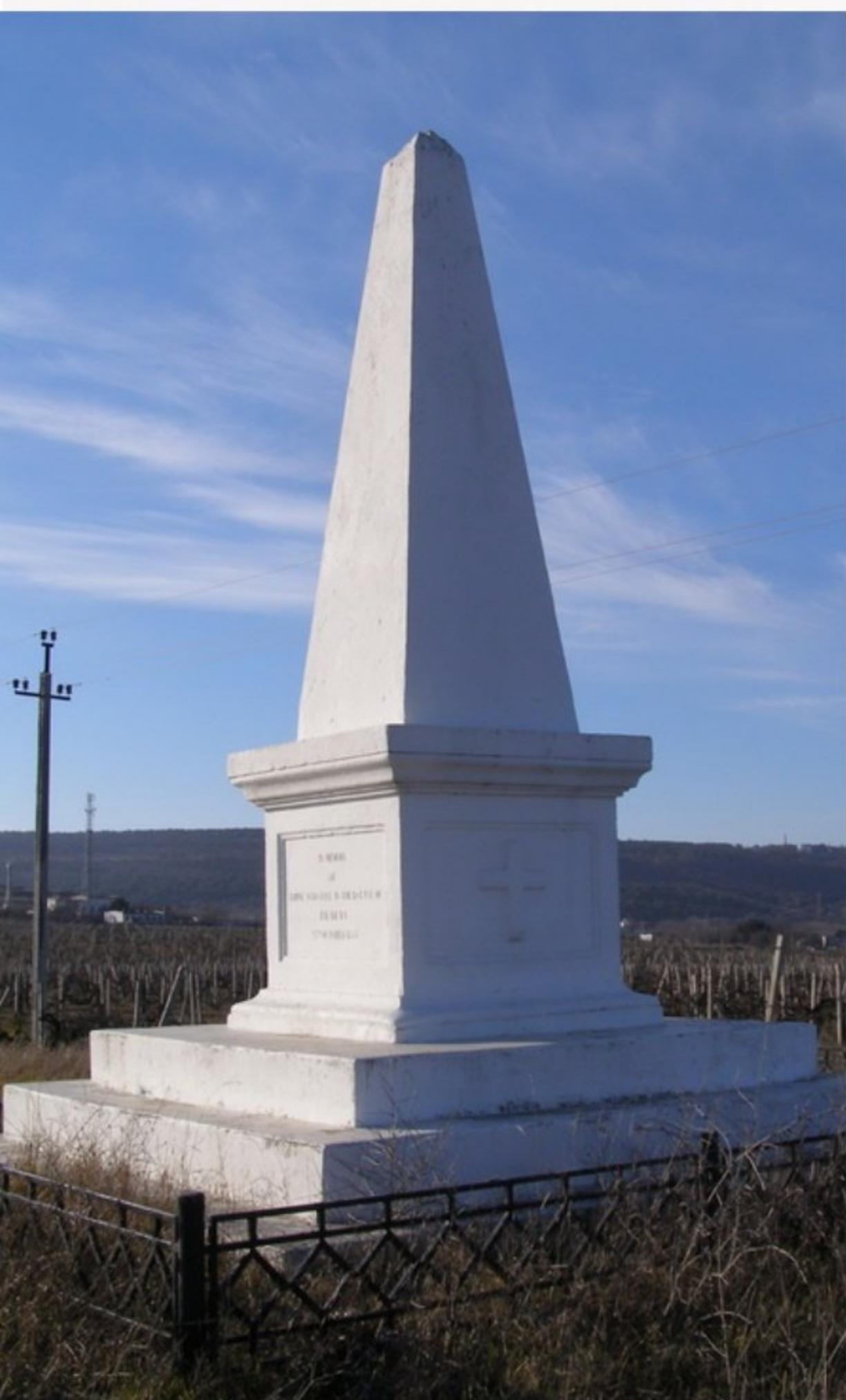
Английский памятник на месте Балаклавского сражения. 1856 г.