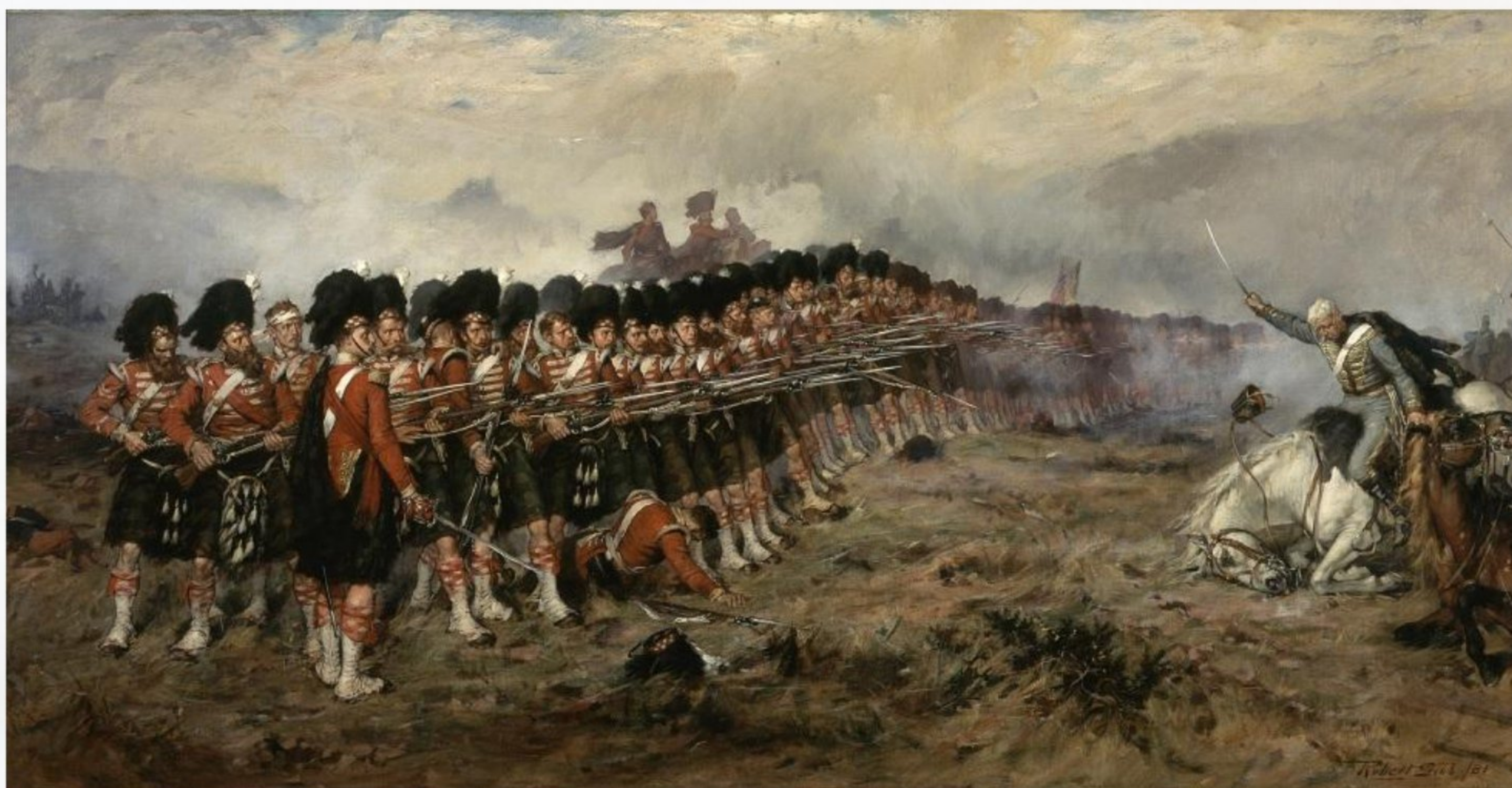
Роберт Гиббс. Тонкая красная линия (1881)