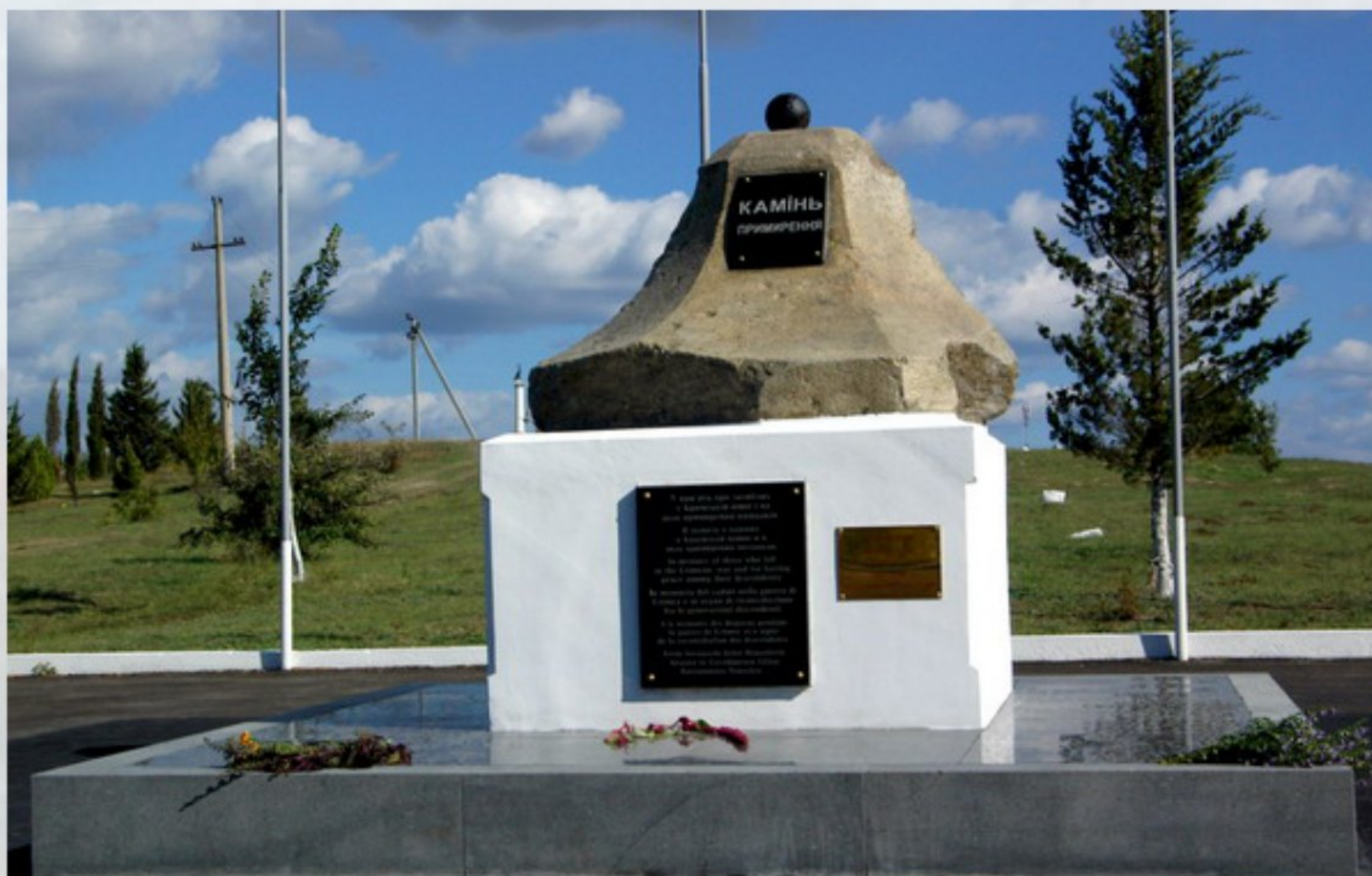
Памятник «Примирение держав – участниц Крымской войны 1853–1856 гг.»

14 сентября 1994 года в Балаклавской долине, в районе бывшего английского четвертого редута состоялось открытие памятника «Примирение держав – участниц Крымской войны 1853–1856 гг.» На памятнике мемориальная надпись на английском и русском языке: «В память всем тем, кто погиб в Крымской войне, и за прочный мир между их потомками».