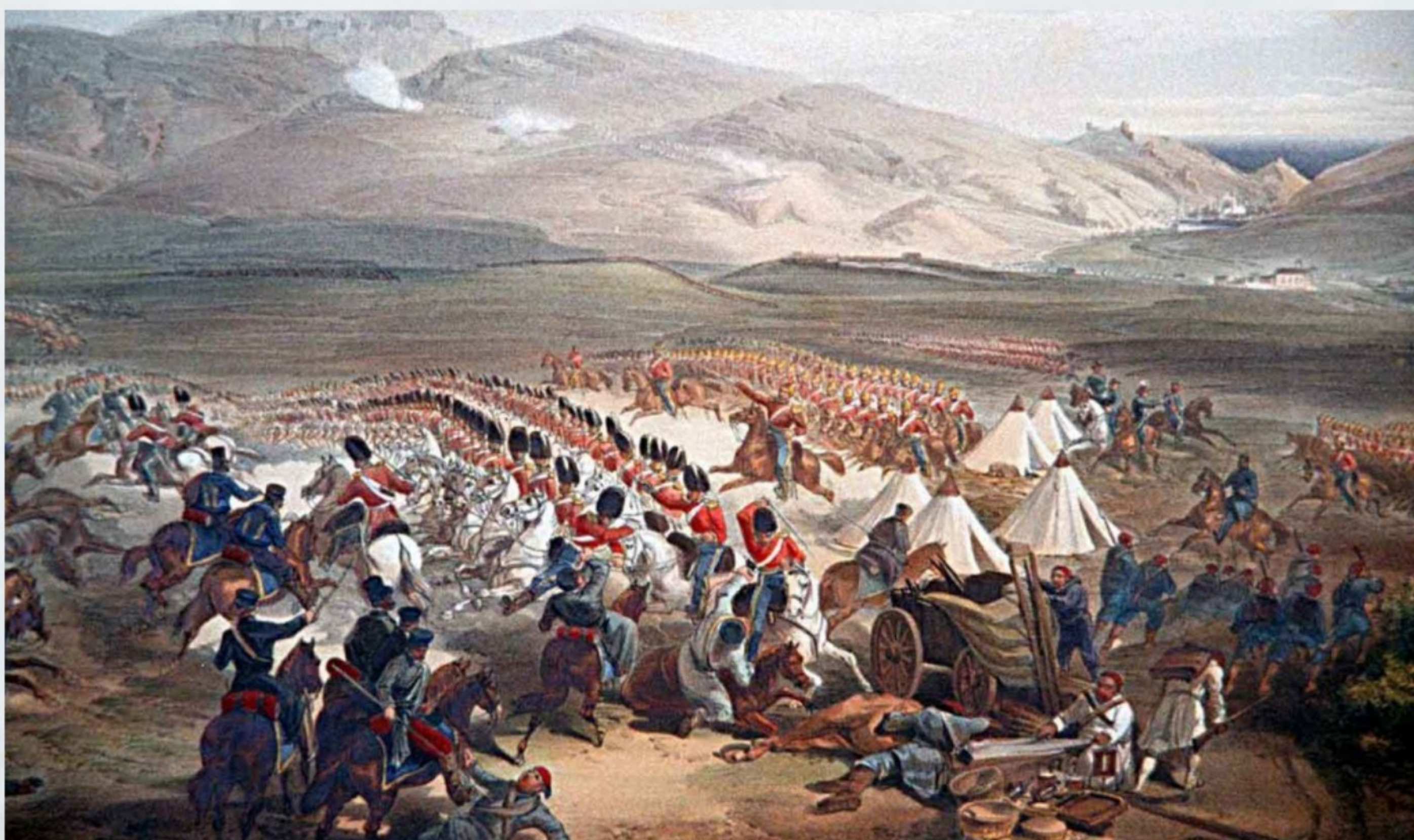
Уильям Симпсон. Атака тяжелой кавалерийской бригады, 25 октября 1854 года (1855)

Судьба кладбища британским солдатам, павшим во время Крымской кампании.