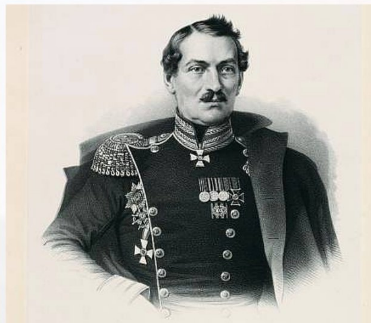
Генерал-лейтенант П. П. Липранди (1796–1864), начальник 12 пехотной дивизии, командующий русским отрядом в Балаклавском сражении.

Но лорд Раглан был крайне недоволен потерей девяти орудий в начале боя и отдал приказ, приведший к трагическим последствиям.