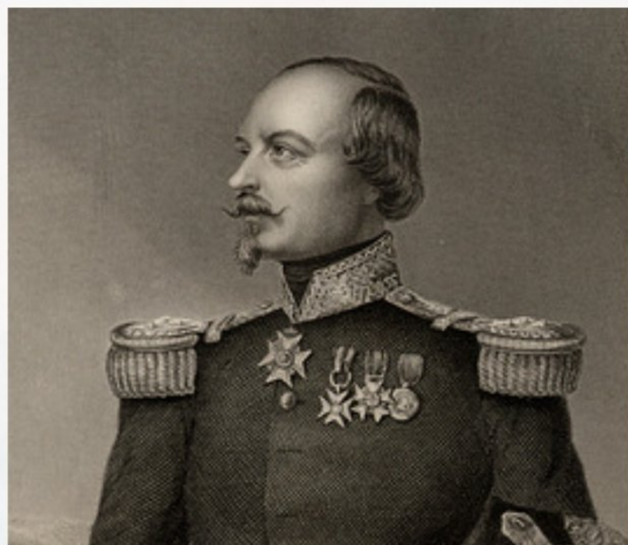
Маршал Франсуа Канробер, главнокомандующий французскими и союзными войсками.

Сражение началось около пяти утра, ещё до рассвета. Русские штыковой атакой выбили турецкие войска из редута № 1, расположенного на южном фланге, и уничтожили около 170 турок. Три оставшиеся редута, расположенные к северу и северо-западу, были брошены турками без боя. Панически бежавшие турецкие войска не привели в негодность артиллерию, располагавшуюся на редутах, и русским в качестве трофея досталось девять орудий. Англичанам пришлось останавливать отступавших турок силой оружия. После захвата редутов генерал-лейтенант Липранди двинул в атаку гусарскую бригаду генерал-лейтенанта И. И. Рьжова с целью уничтожения английского артиллерийского парка, как предполагалось по диспозиции, составленной накануне сражения. Выйдя к объекту атаки, генерал-лейтенант Рьжов обнаружил вместо предполагаемого артиллерийского парка подразделения тяжёлой кавалерийской бригады англичан. Русских гусар и английских драгун разделяла часть полевого палаточного лагеря английской лёгкой кавалерийской бригады, которая, скорее всего, нака-