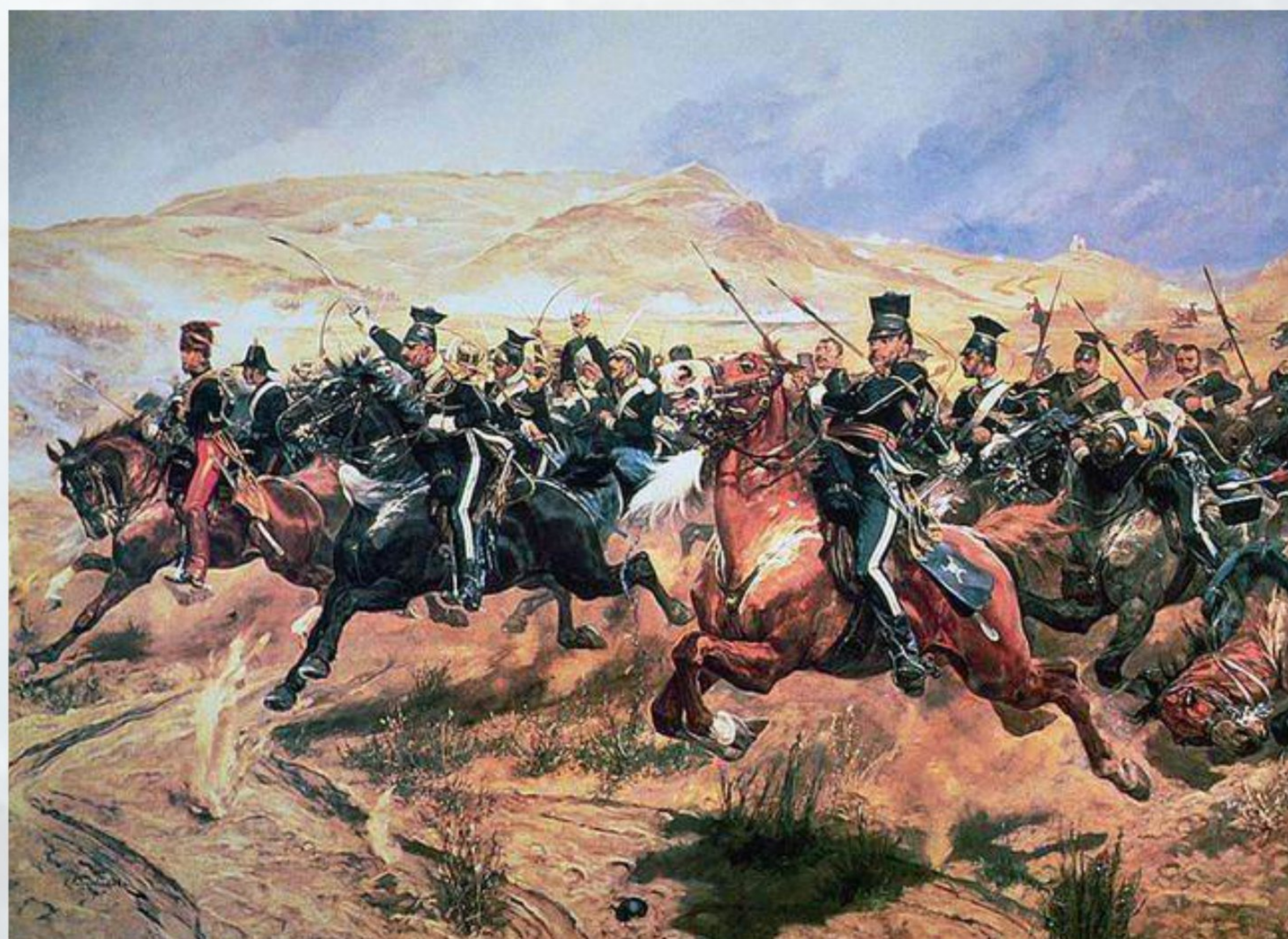
Ричард Вудвилль. Атака лёгкой бригады. (1855)