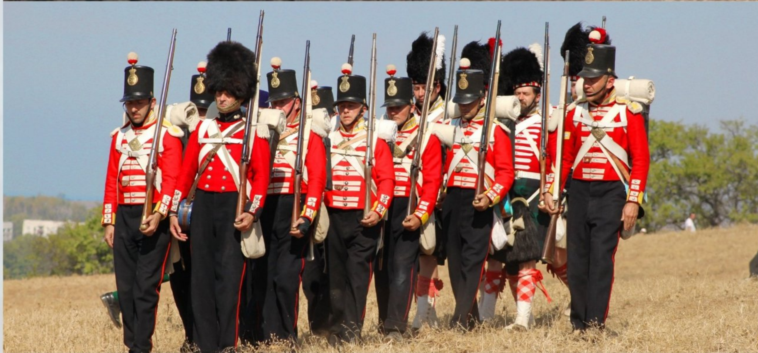
«Реконструкторы – участники Международного военно-исторического фестиваля Альминское дело»