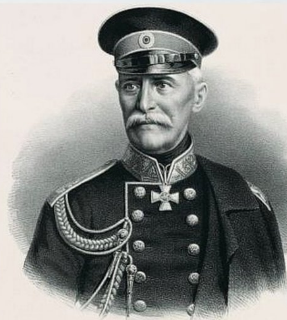
Светлейший князь А. С. Меншиков — главнокомандующий военно-сухопутными и морскими силами в Крыму

Русские войска сражение проиграли. Сказалось преимущество союзников в артиллерии и стрелковом вооружении /нарезные ружья против гладкоствольных/, отсутствие плана и ру-