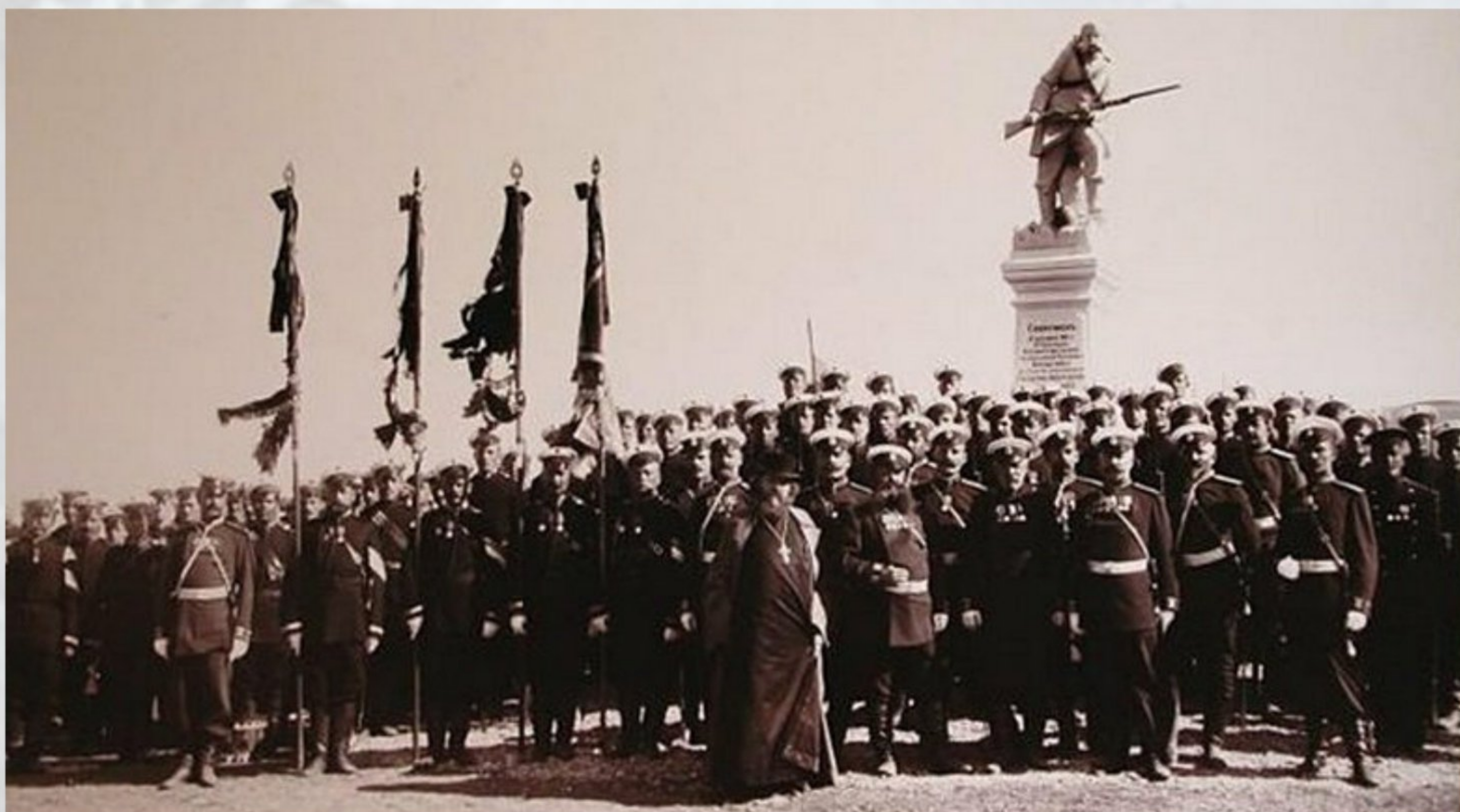
Открытие на Альминском поле памятника Владимирскому полку 8 сентября 1902 года

Торжественное открытие памятника состоялось 8 сентября 1902 г. Это был первый памятник в России, когда рядовой воин был изображен в полный рост. Постамент памятника был изготовлен в Севастополе, в мастерской И. И. Сеппи. Фигура воина-владимирца была заказана в Италии, у известного скульптора Баскерини. На пьедестале памятника были сделаны надписи: «Здесь 8 сентября 1854 г. Владимирский мушкетерский полк под командованием полковника Ковалева отражал атаки англичан, три раза бросаясь в штыки и опрокидывая их к реке Альме. Он потерял 51 офицера и 1260 нижних чинов убитыми и ранеными». Вторая надпись на памятнике: «Сооружен 8 сентября 1902 г, 61-м пехотным Владимирским полком в командование полковника Бокщанина, на средства, пожертвованные государем императором Александром II».