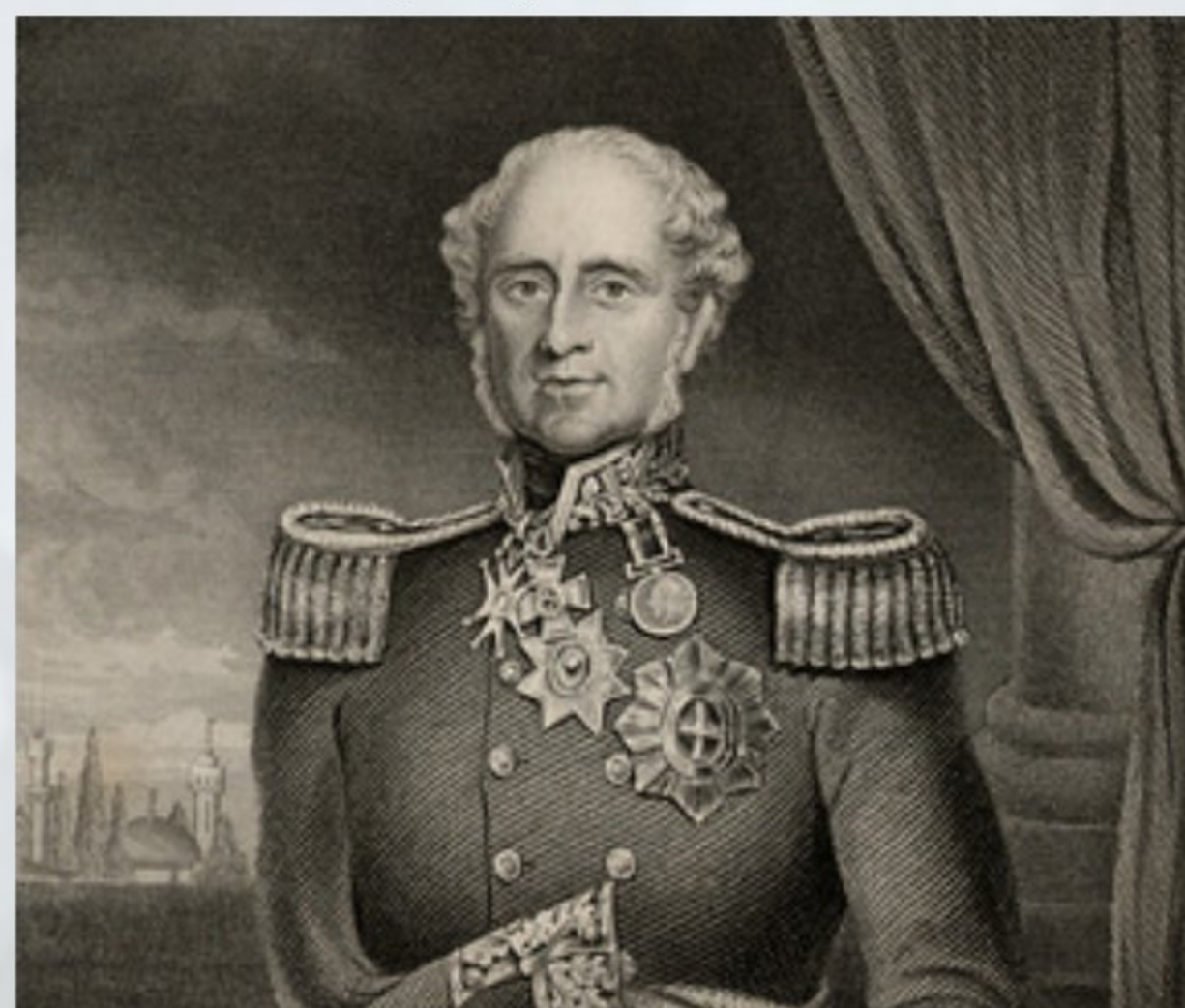
Маршал лорд Ф. Раглан — главнокомандующий английской армией в Крыму