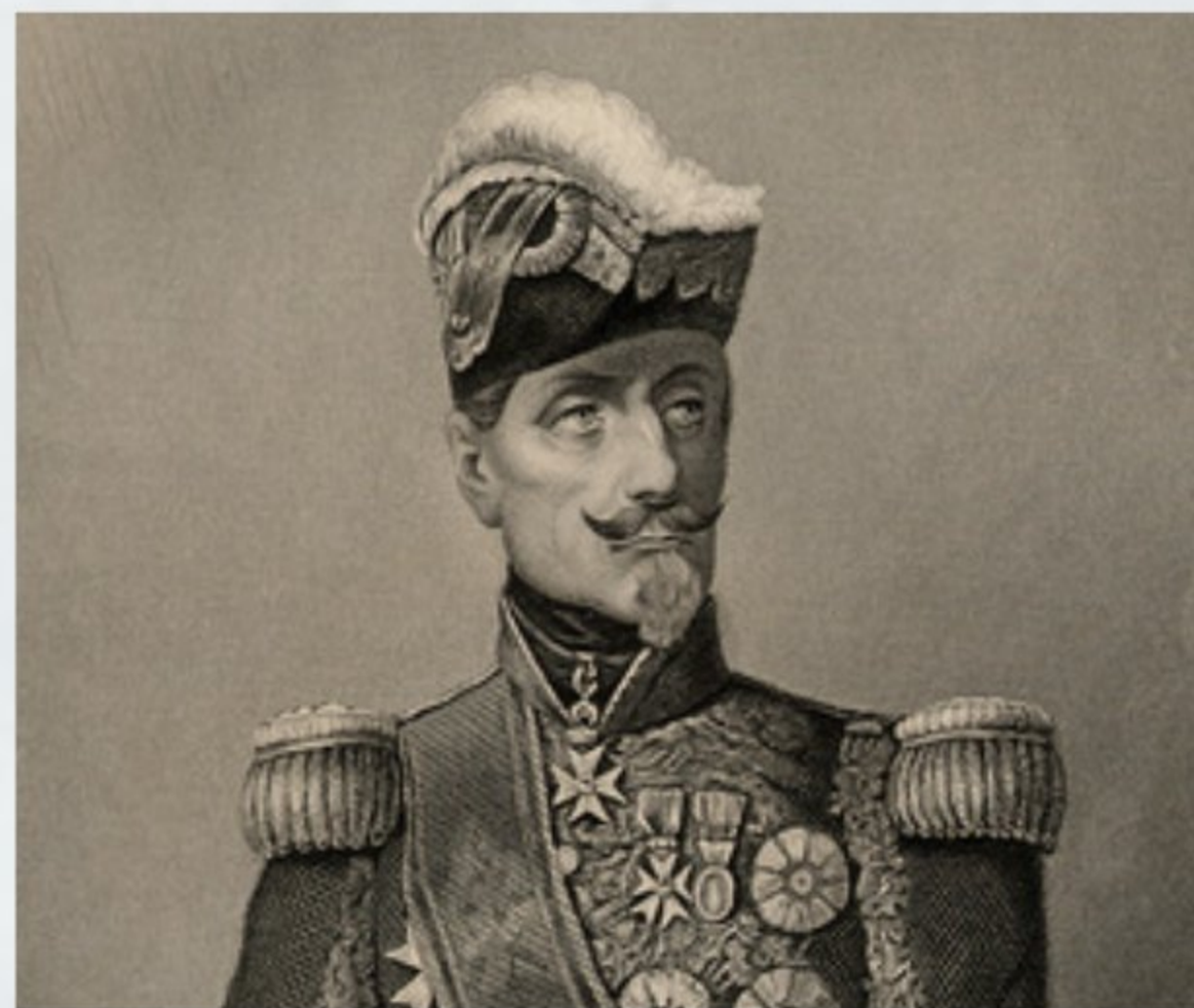
Маршал Сент-Арно — главнокомандующий французской армией в Крыму

Турецкая армия насчитывала до 7 тыс. чел. При 12 полевых орудиях и возглавлял ее сардарэкрем (фельдмаршал) Омер-паша.