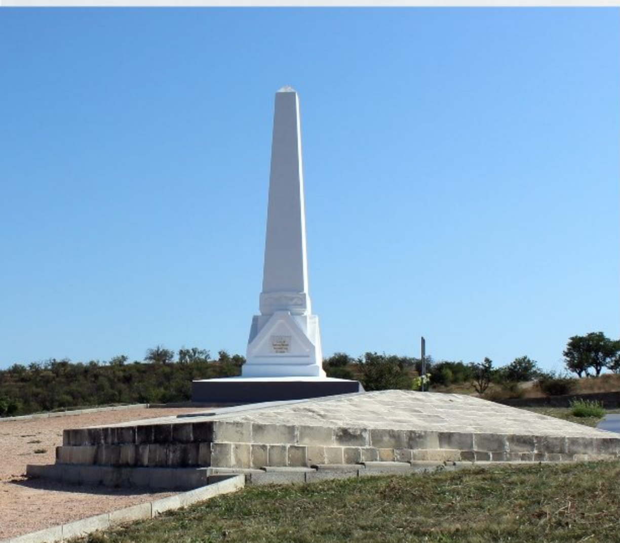
Военно-исторический мемориал «Поле Альминского сражения». Памятник-obelisk