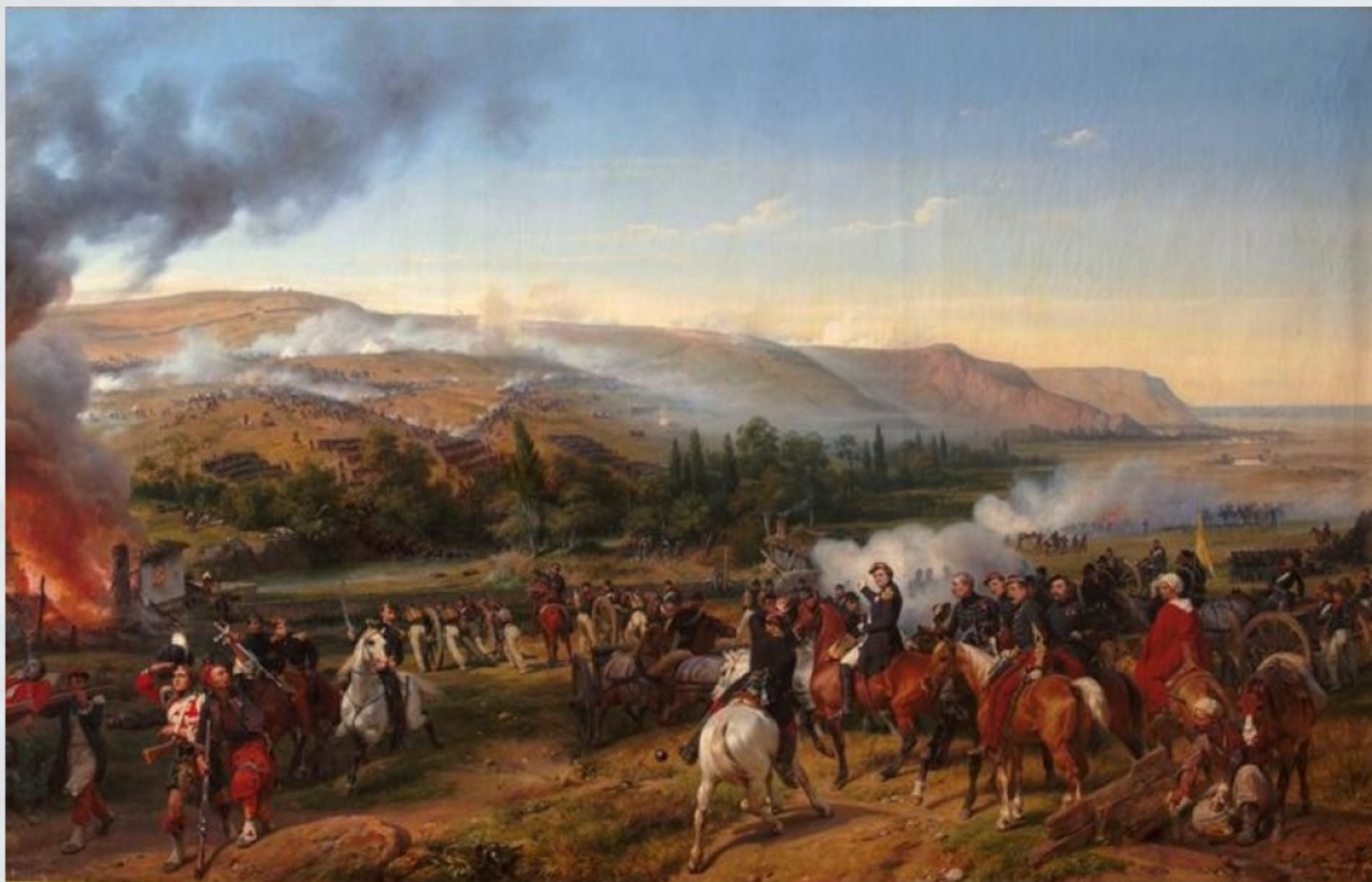
Орас Верне «Битва при Альме»

Мероприятия в память об Альминском сражении 8(20) сентября 1854 г.