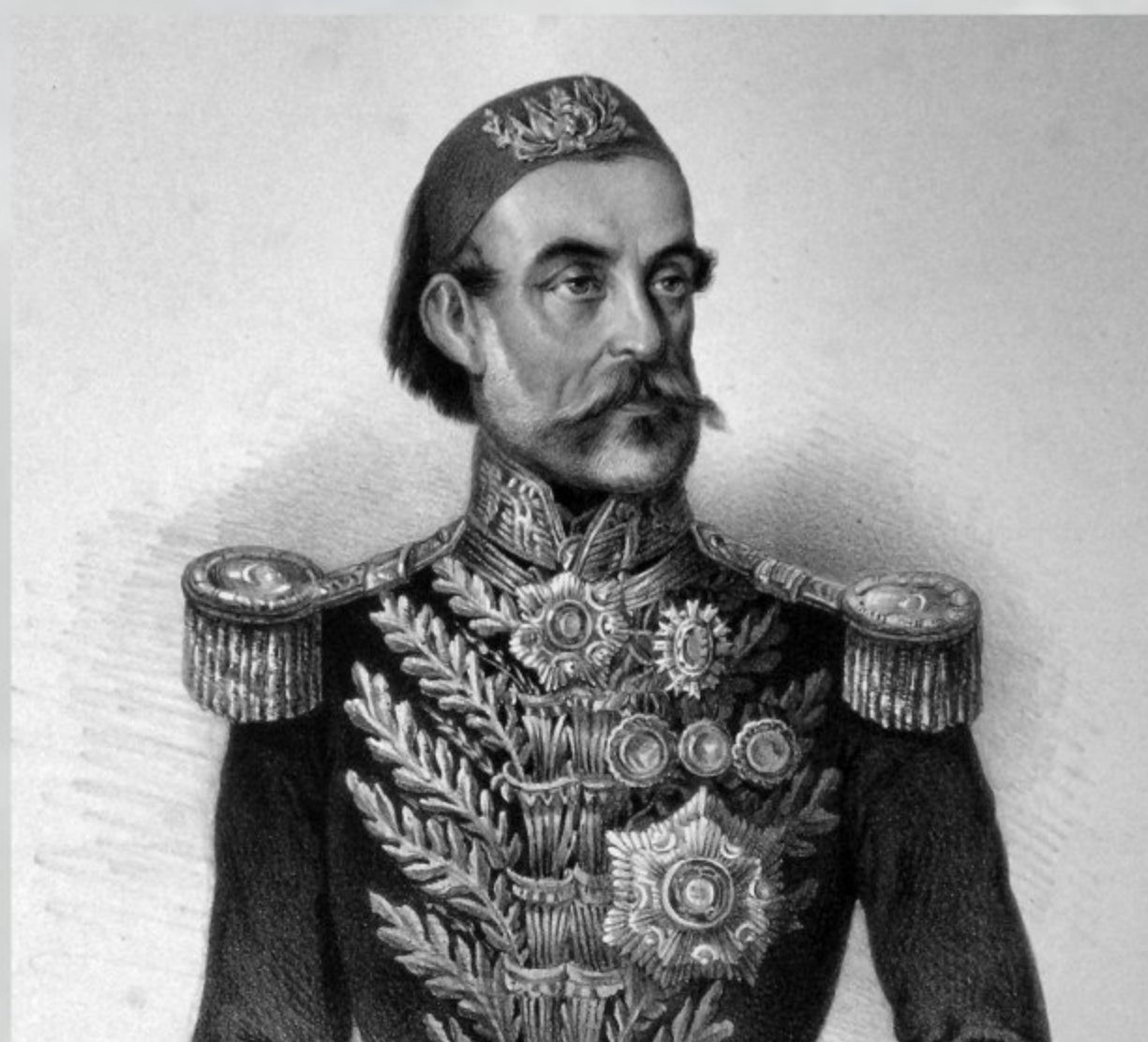
Сардарэкрем (фельдмаршал) Омер-паша — главнокомандующий турецкой армией в Крыму