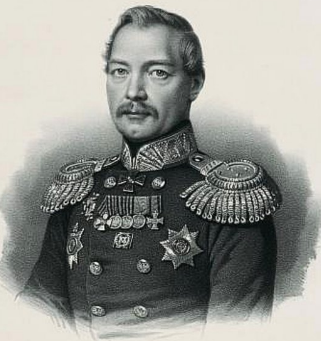
Генерал-лейтенант В. Я. Кирьяков начальник 17-й пехотной дивизии