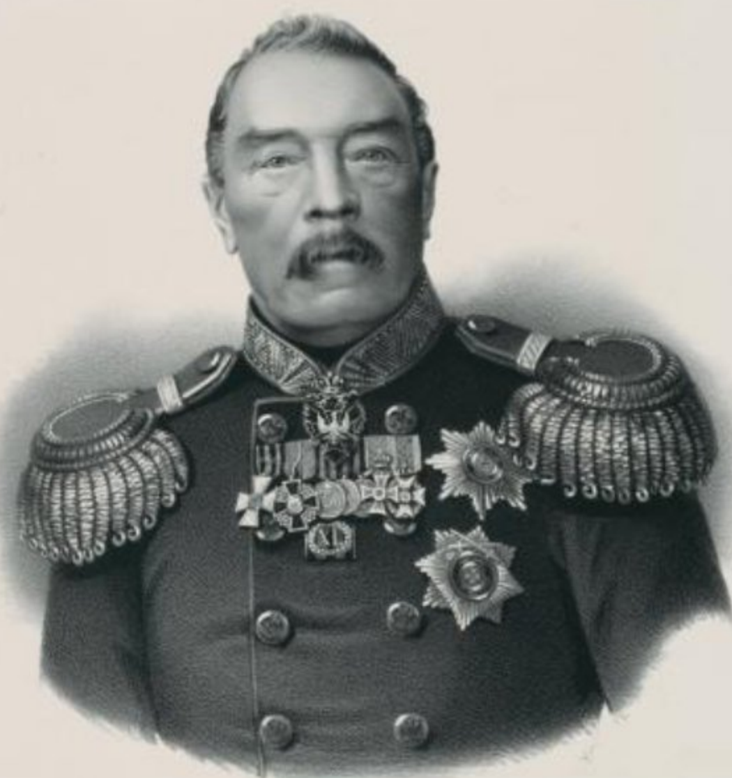
Генерал от инфантерии П. Д. Горчаков командир 6-го пехотного корпуса