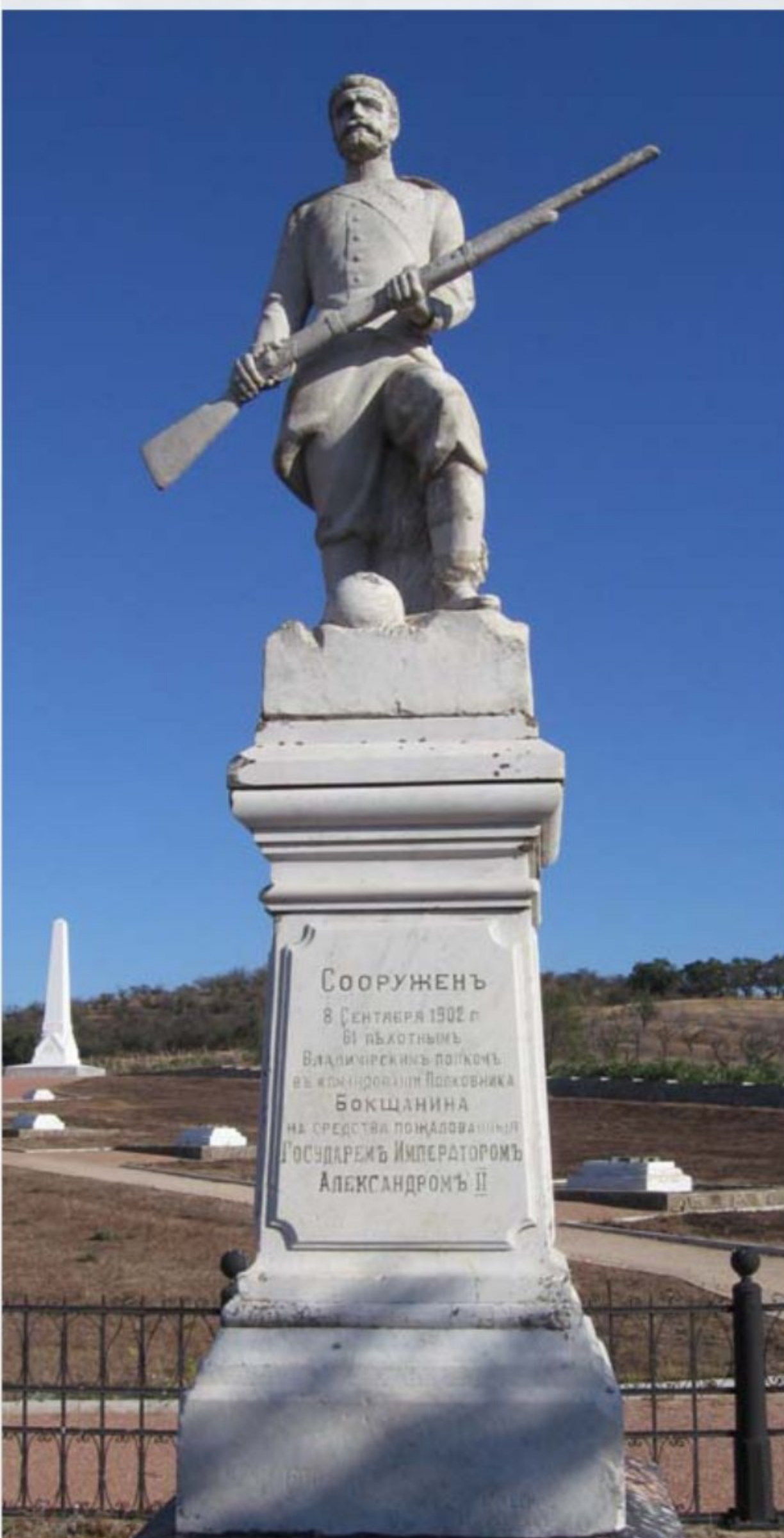
Военно-исторический мемориал «Поле Альминского сражения». Памятник солдатам и офицерам Владимирского пехотного полка

ководства сражением, неподготовленность Альминской позиции в инженерном отношении. Русские войска, потеряв 5700 человек, отступили к Севастополю. Потери союзников — 4300 человек.