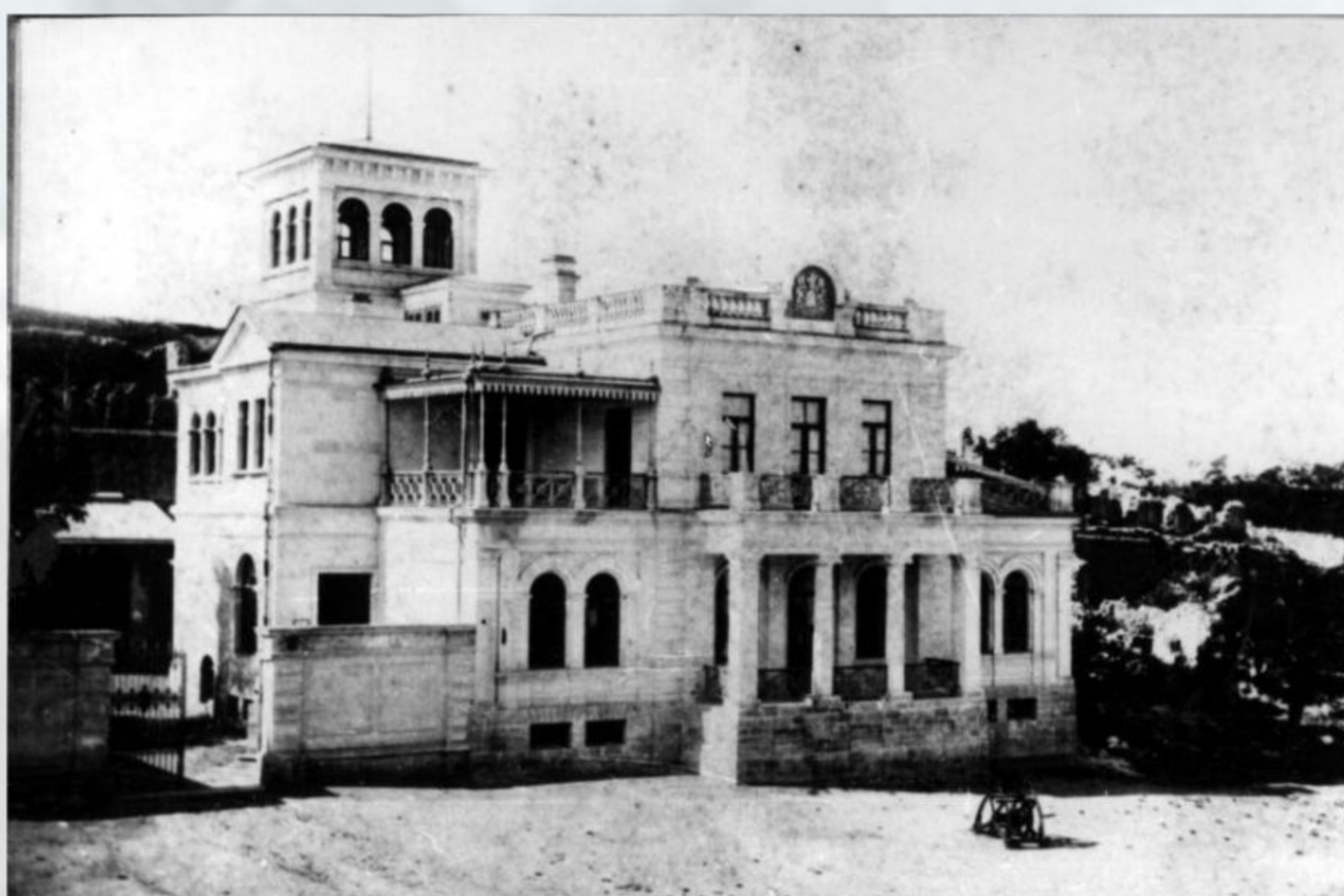
Дом Э. И. Тотлебена, в котором в 1869 г. был открыт Музей Севастопольской обороны.