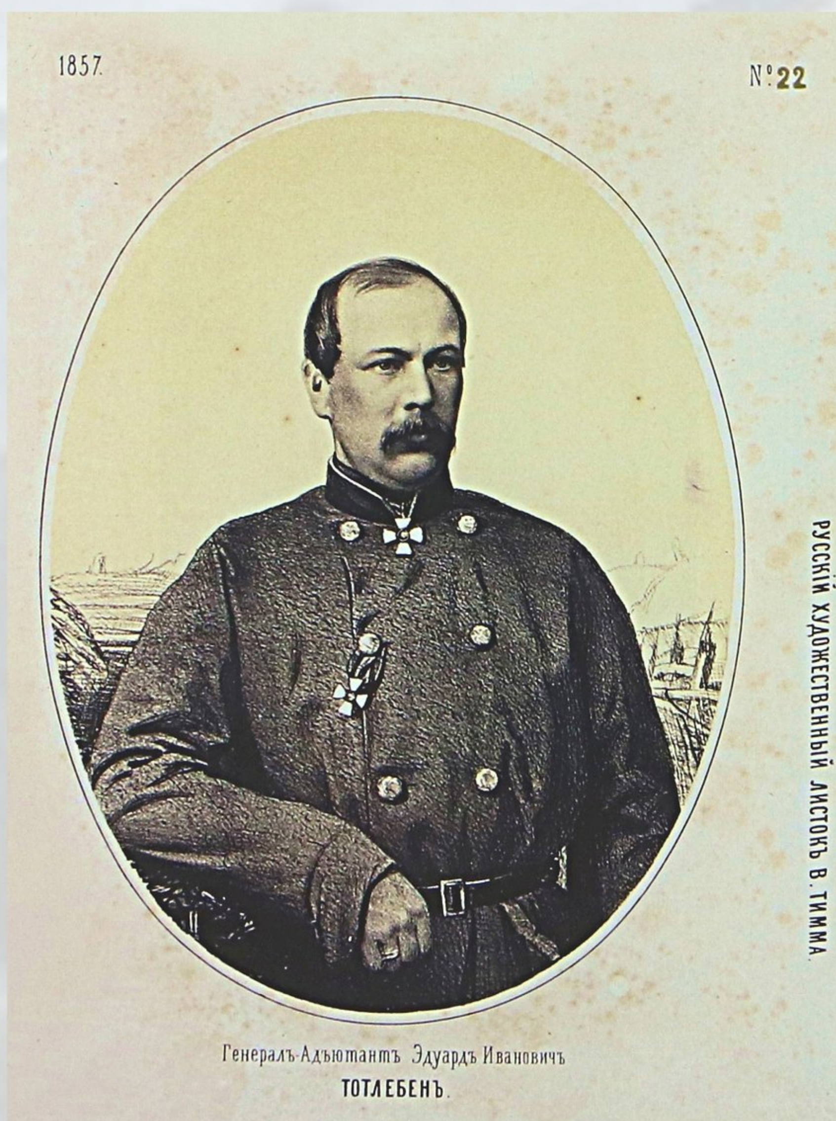
Генерал-адъютант Эдуард Иванович Тотлебен. «Русский художественный листок». 1857. №22.

Тотлебен // Материал из Википедии — свободной энциклопедии. Режим доступа: https://ru.wikipedia.org/wiki