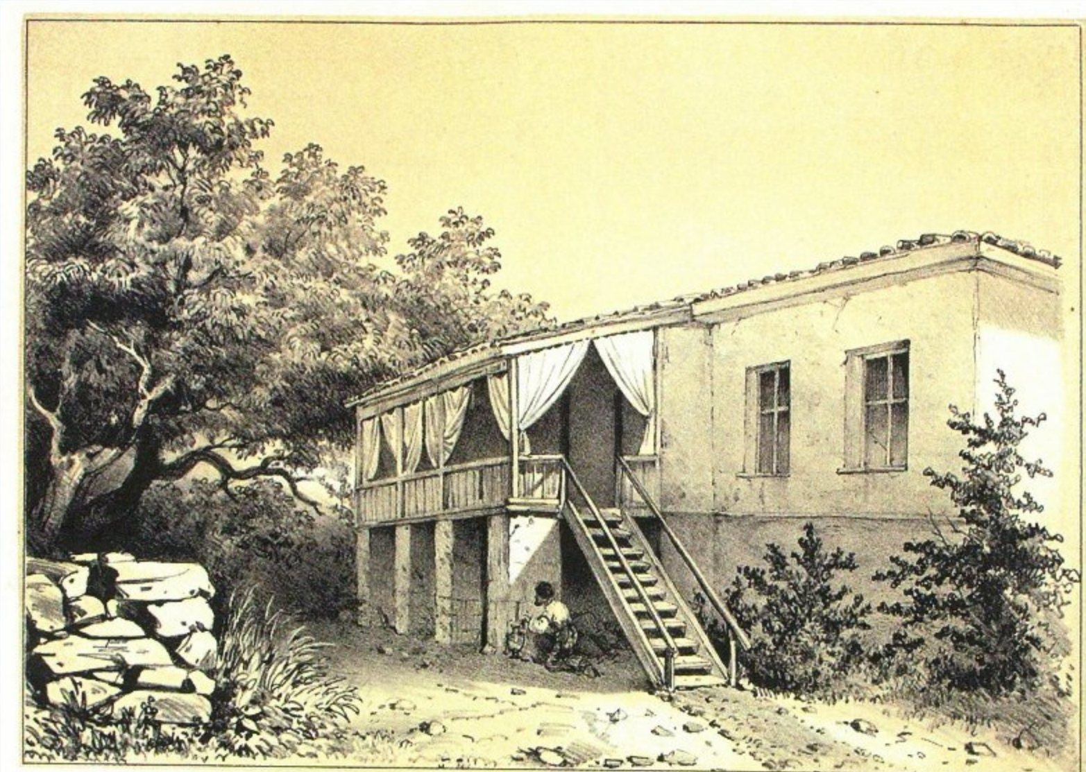
К. Филиппов. «Дом на Бельбеке, в котором жил Э. Тотлебен во время лечения раны, полученной при обороне Севастополя». «Русский художественный листок». 1857. №9.

ков обороны Севастополя 1854-1855 гг., Эдуард Иванович поручил им составление истории этой обороны. Трехтомный труд под названием «Описание обороны г. Севастополя», составленный под руководством генерал-адъютанта Тотлебена, был издан в Санкт-Петербурге в 1863-1872 гг. Параллельно с изданием на русском языке шла работа по его переводу на французский и немецкий языки. К этой работе были привлечены граф Сюзор для перевода на французский и известный военный писатель Шмидт для перевода на немецкий. До сих пор названная работа является одним из лучших источников по истории обороны города Севастополя 1854-1855 гг.