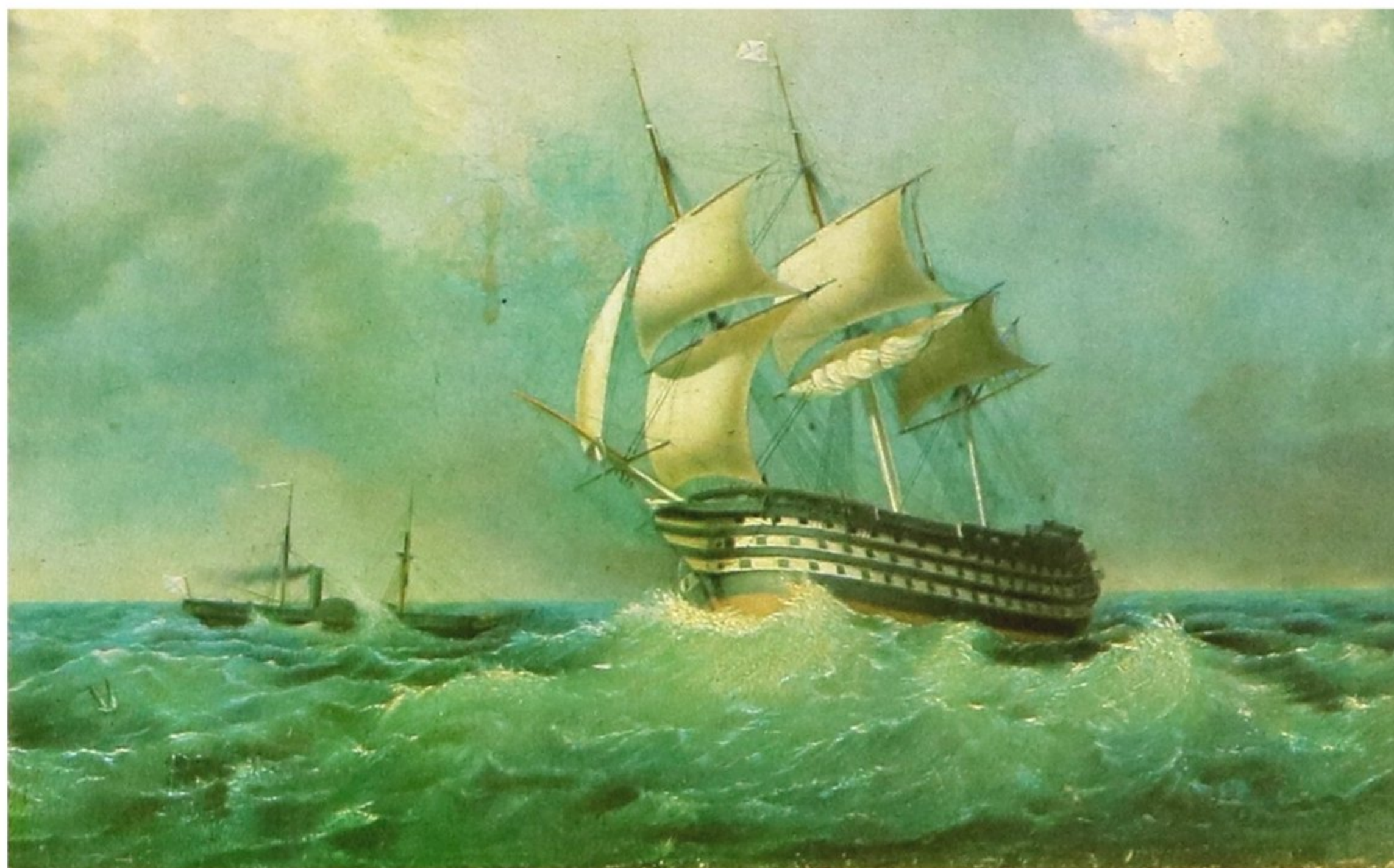
«120-пушечный корабль "Париж"» Художник И. К. Айвазовский

вал в переброске войск 13 пехотной дивизии из Севастополя на Кавказ, а 18 ноября 1853 г. *) принял участие в Синопском сражении. Под его командованием «Париж» вел огонь по нескольким кораблям, взорвал