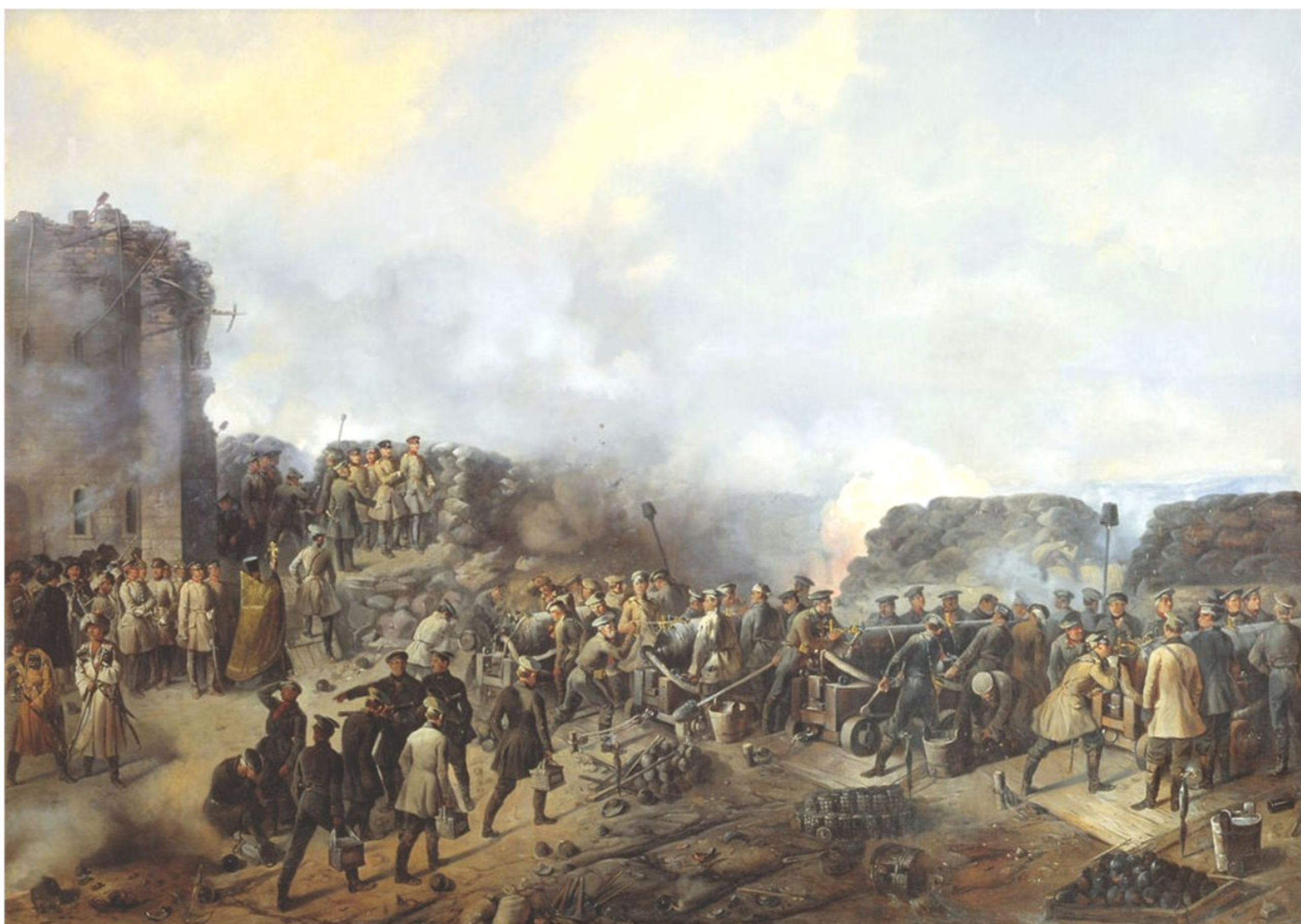
Бой на Малаховом кургане в Севастополе в 1855 году. Художник Григорий Фёдорович Шукоев 1856г.