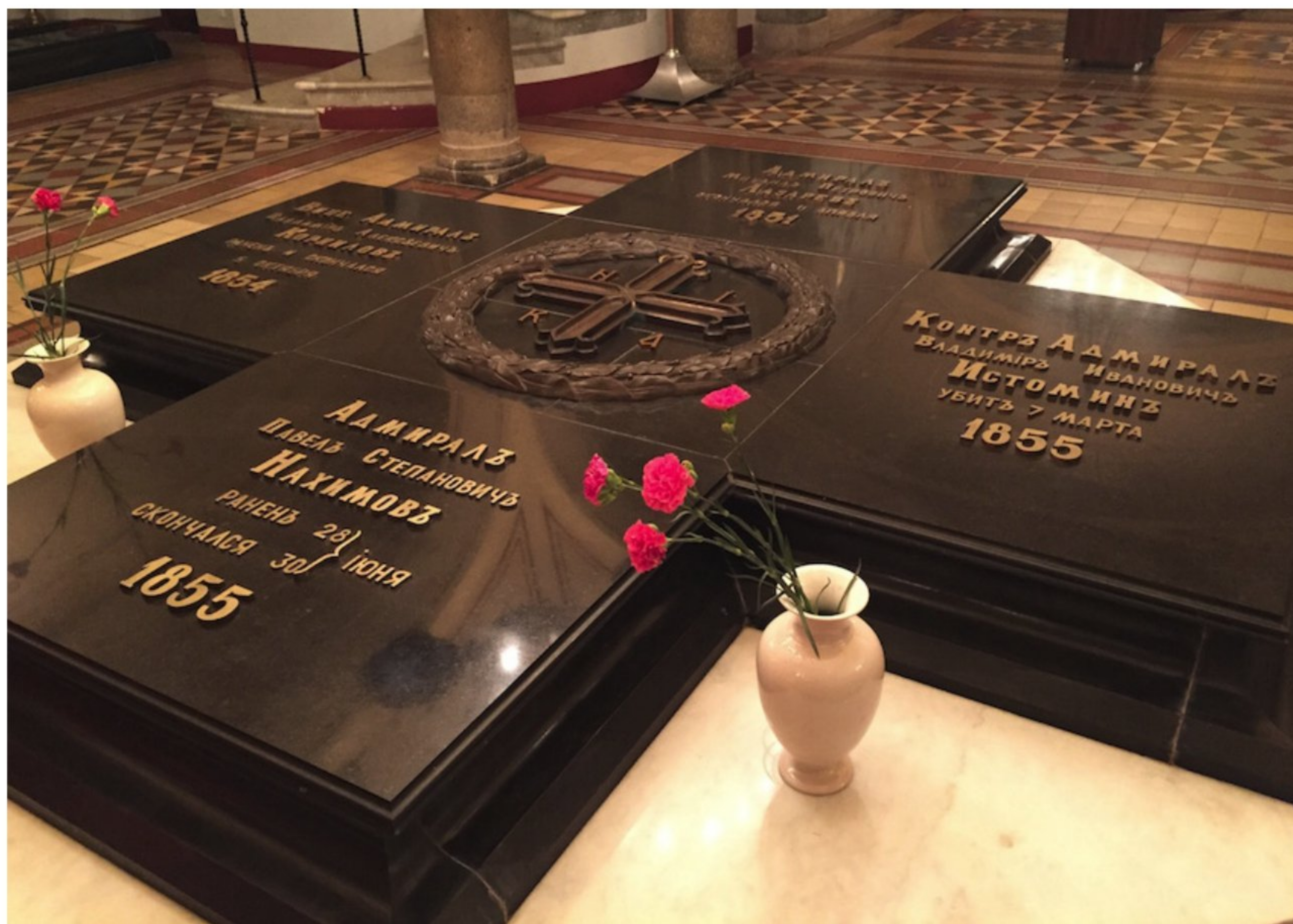
Церковь Святого Николая — нижний храм Владимирского собора, место захоронения тринадцати адмиралов Черноморского флота

Вспоминая Владимира Ивановича, адмирал П. С. Нахимов писал: «...Твердость характера в самых тяжелых обстоятельствах, святое исполнение долга и неусыпная заботливость о подчиненных, снискали ему общее уважение и непритворную скорбь о его смерти».