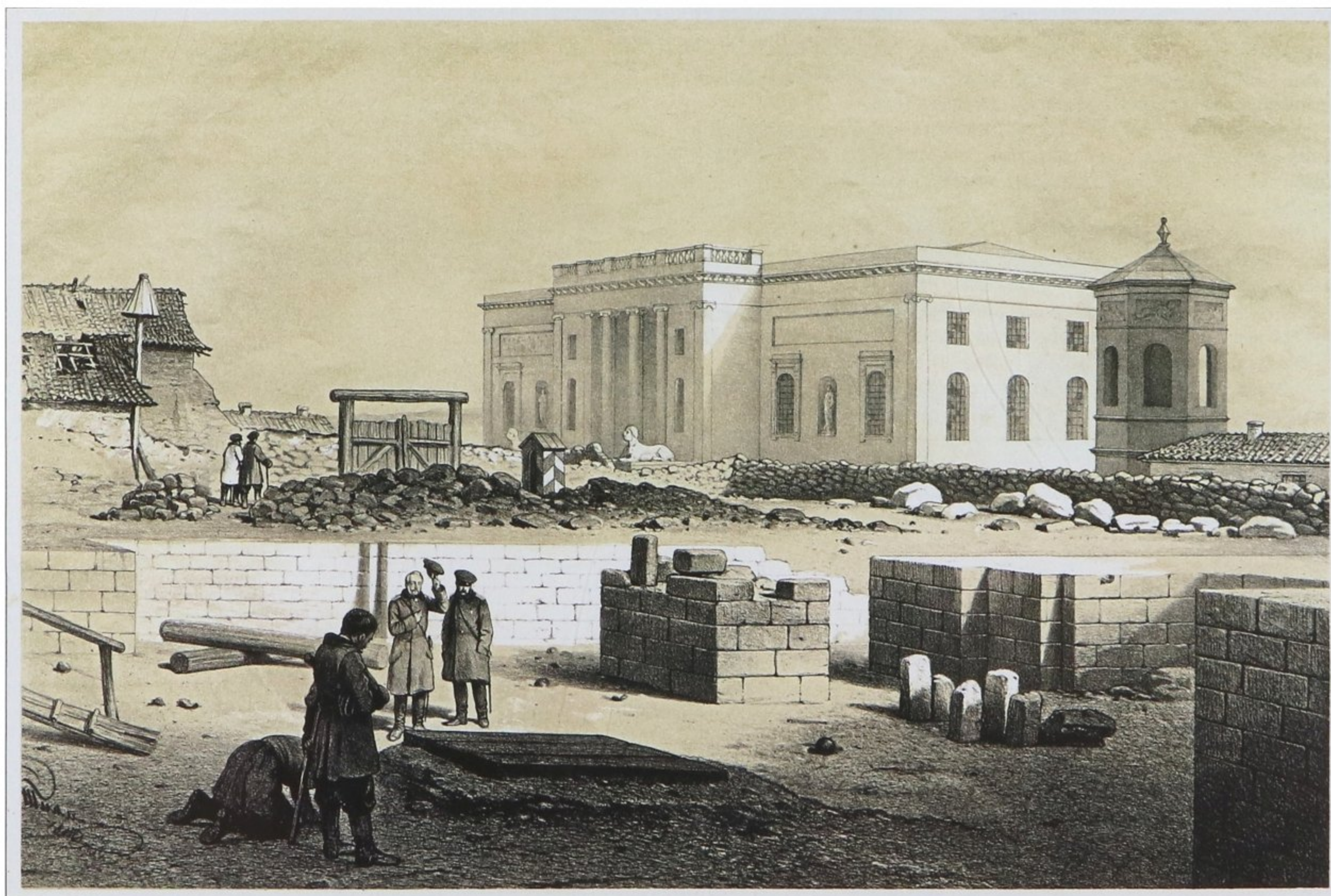
Могила Адмиралов М.П. Лазарева, П. С. Нахимова, Вице-адмирала В. А. Корнилова и Контр-Адмирала В. И. Истомина в склепе сооружаемой Церкви Св. Владимира, в Севастополе. «Русский художественный листок». 1856. №26

Погребен в склепе нижнего храма Владимирского собора-усыпальницы Морского ведомства в Севастополе. Увековечен в Георгиевском зале Большого Кремлевского дворца в Москве, в церкви Морского кадетс-