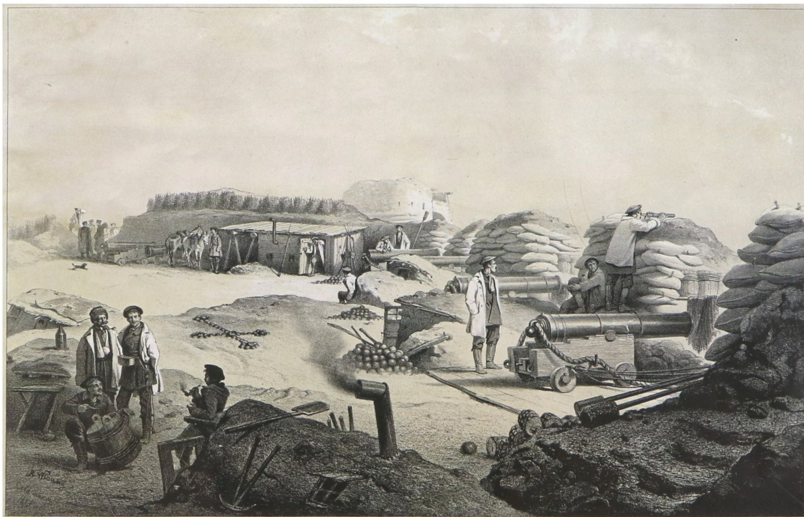
Внутренность одной из батарей Корниловского (Малахова) Кургана, на которой убит Генерал-Адъютант Вице-Адмирал В. А. Корнилов, 5 октября 1854 года, в Севастополе. «Русский художественный листок». 1856. №14.

дил закладкой передовых укреплений Корабельной стороны Севастополя — Волынского и Селенгинского редутов и Камчатского люнета. Очевидец отмечал: «Ис-