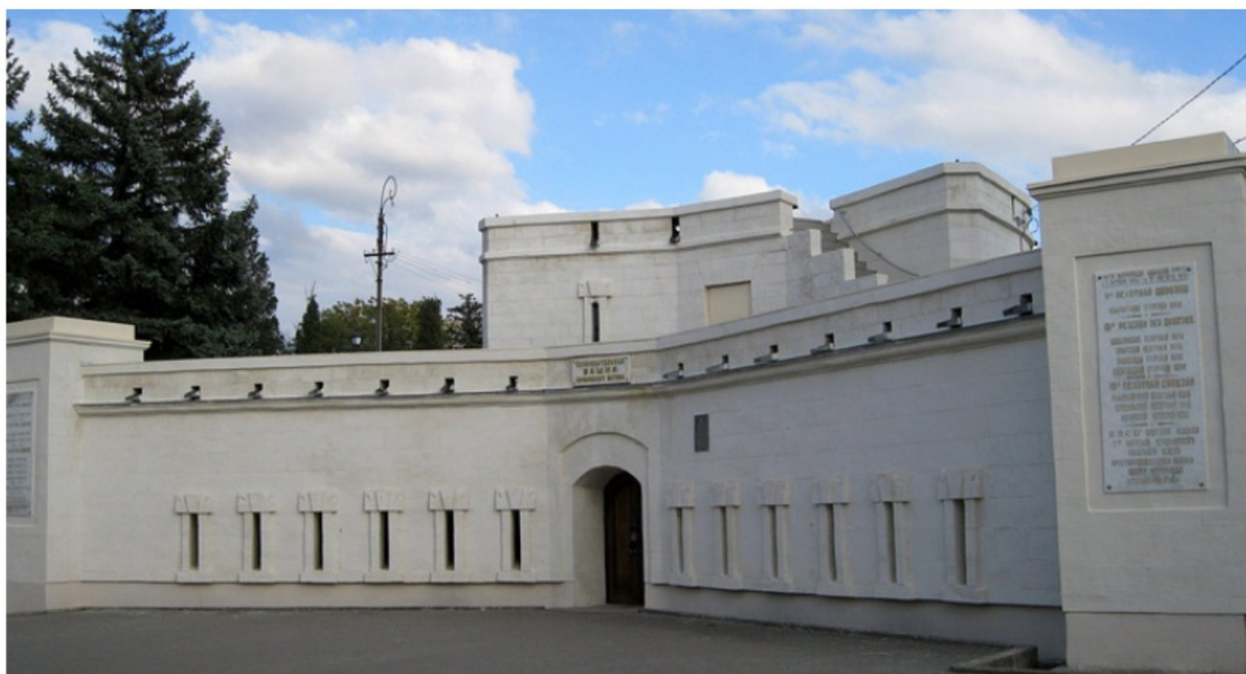
Оборонительная башня времен Крымской войны (1853-1856) на Малаховом кургане в Севастополе после реставрации

Поминальное богослужение во Владимирском соборе-усыпальнице адмиралов в честь 25-летия перезахоронения прославленных русских адмиралов – М. П. Лазарева, В. А. Корнилова, В. И. Истомина и П. С. Нахимова.